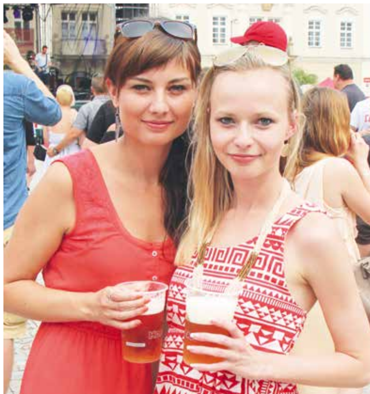
■ Pán nebo slečna, dobré pivo chutná všem. Znojemské Pivní slavnosti tak budou i letos vítanou zábavou pro širokou veřejnost.

O všech připravovaných akcích se více dozvíte uvnitř LISTŮ. lp