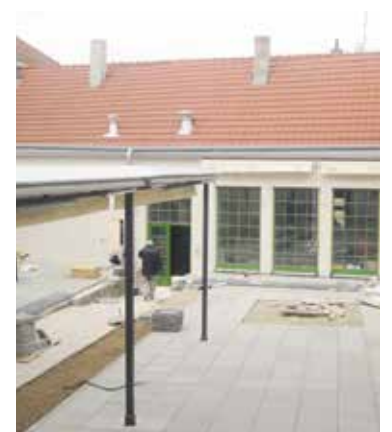
■ HoZpoda – před rekonstrukcí a stav před jejím dokončením.