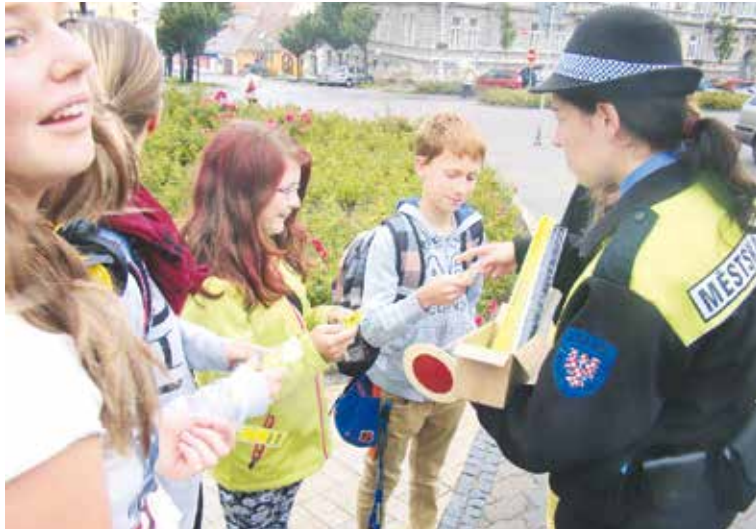
■ Strážníci ve Znojmě během roku několikrát v rámci prevence bezpečnosti chodců rozdávají dětem reflexní prvky.

Konzultační tým budou opět tvořit vždy český a rakouský odborný pracovník, v případě potřeby je zajištěno tlumočení. Jednotlivé konzultace budou poskytovány bezplatně. Přednost při poradenství budou mít předem objednaní klienti. ČSSZ a PV žádají případné účastníky, aby si na konzultaci s sebou vzali doklady o pojištění (důležité je především rodné číslo a rakouské číslo pojištění), případnou korespondenci s nositelem pojištění, pracovní smlouvy a podobně.