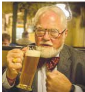
■ Robert Fulghum.

Popularitu si získal především svými vtipnými knížkami. Patrně nejznámější je titul s předlouhým názvem Všechno, co opravdu potřebuju znát, jsem se naučil v mateřské škole. Na LiStOVÁní do Zno-