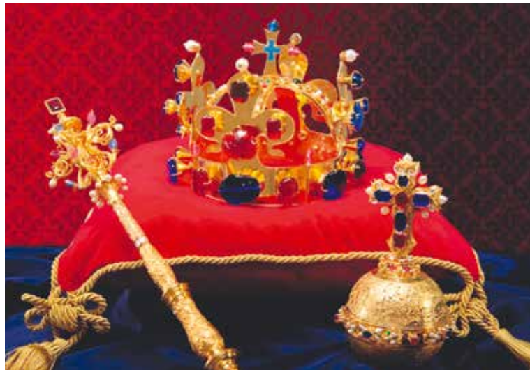
■ Repliky českých korunovačních klenotů vytvořil jeden z nejlepších českých i evropských zlatníků současnosti Jiří Urban. Návštěvníci výstavy si mohou ve Znojmě pořídit i miniatury těchto klenotů. Informace získají na pokladně hradu.

Na obou výstavách jsou ovšem bohatě prezentovány i další zajímavosti a unikáty vztahující se ke Karlu IV. Další informace o výstavách najdete na str. 15, na www.muzeumznojmo.cz a tel.: 515 282 223. lp