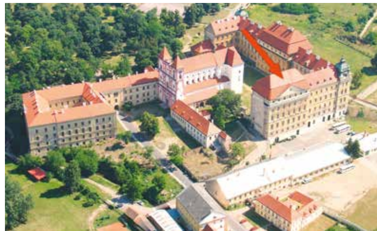
■ Šipka ukazuje jižní křídlo nového konventu, které bude mít od podzimu nová okna.

Město Znojmo je vlastníkem Louckého kláštera od roku 2010, kdy jej na město bezúplatně převvedl stát, avšak pod podmínkou nepřevoditelnosti majetku na další osoby po dobu dvaceti let. Další podmínkou je využití areálu ve veřejném zájmu. Od té doby se město snaží postupnými opravami měnit tvář Louckého kláštera k lepšímu. Kompletní rekonstrukce se již dočkala například bývalá jízdárna, další investice putovaly do oprav fasády bývalé konírny. Areál kláštera je v tuto chvíli využíván zejména v suterénní části nového konventu, v objektu jízdárny a kladiva, a to společností Znovín Znojmo, která zde provozuje aktivity zaměřené na vinařství. zp