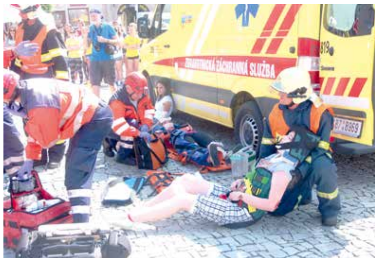
■ Ukázkou práce záchranných složek uvidíte 7. června v centru Znojma.

Jako každým rokem, i letos budou studenti Střední zdravotnické školy a Vyšší odborné školy zdravotnické Znojmo představovat na Horním náměstí raněné z havarovaného auta.