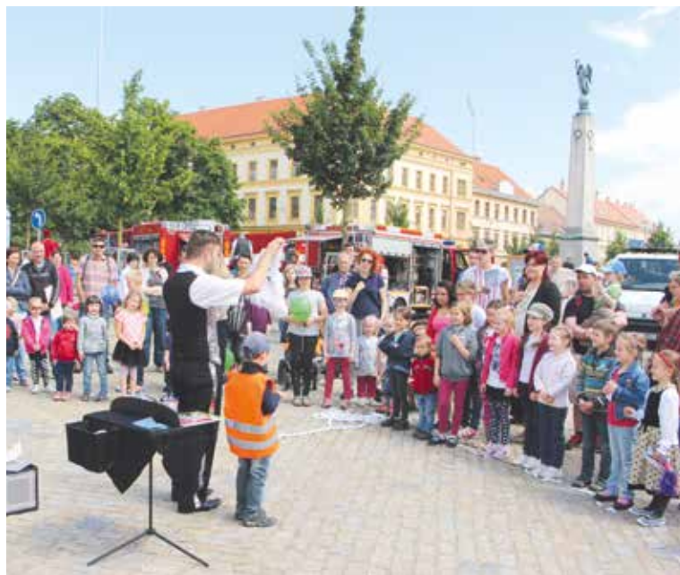
■ Stejně jako vloni, i letos bude Komenského náměstí zcela patřit na jeden den jen dětem a zábavě.

a nápoji. Uvidí ukázkou činnosti hasičů, policie i záchranářů. Na celodenní akci nebudou chybět hráči amerického fotbalu Znojmo Knights, HC Orli Znojmo, Agentura Sluníčko, Cyklo Klub Kučera a další. Tradiční zábavnou akci připravilo dětem město Znojmo, Znojmská Beseda. lp