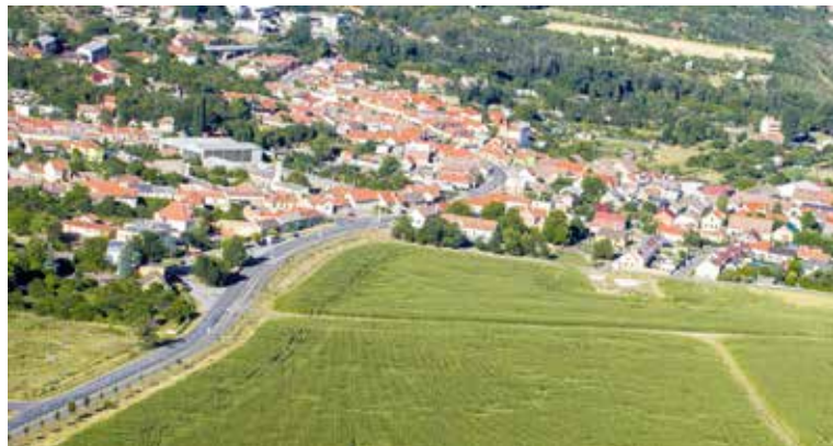
■ Zelená plocha Léry leží za obchodním centrem Stop Shop před vjezdem do Dobšic.

lokality Léry v dolní části města. Jedná se o zelené plochy (za bývalým obchodem Spar) vpravo před vjezdem do Dobšic. Jak toto území uchopili, bude možné veřejnost posoudit od 16.30 hodin v Dukle. lp