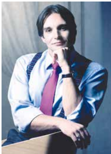
■ Pěvecká bravura Adama Plachetky láká na festival do Znojma i zahraniční hosty.

Festival je neodmyslitelně spjat se svým patronem, excelentním houslovým virtuózem Pavlem Šporcem, který