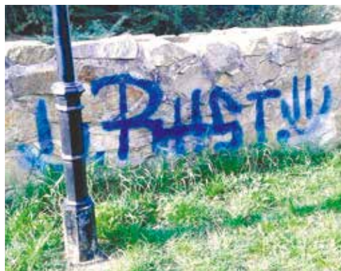
■ Výsledek „práce“ sprejerů-vandalů na hradbách.