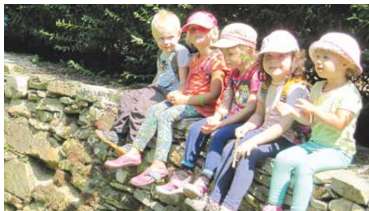
■ Důležitou součástí dne je ve školce Dobromysl pobyt dětí v přírodě.

Školka Dobromysl pořádá 25. května Den otevřených dveří od 14.00 do 18.00 hodin.