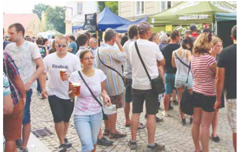
■ K dobrému pivu si lidé budou moci zakousnout dobrého jídla.

ale i v gastronomické nabídce. Pivovar se ostatně postaral i o proměnu stánku u rotundy, kde budou 11. června nabízena ke konzumaci piva, ale také jídla, kávy, zákusky a dobroty pro děti i dospělé.