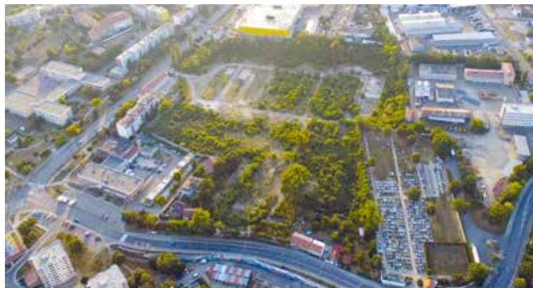
■ V lokalitě Malá Louka má vzniknout 266 nových bytů.

obyvatel, jejich odpočinek a plochy pro sport a rekreaci. Bližší informace včetně regulačního plánu jsou na www.znojmobusiness.cz . zp