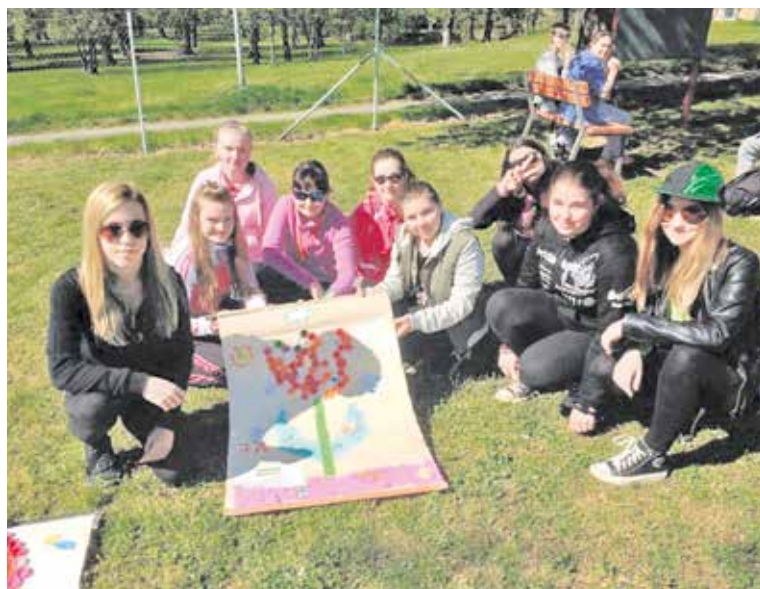
■ Oslavy Dne Země se konaly i na Základní škole JUDr. Josefa Mareše ve Znojmě.

tovalo se lesnictví, chov ryb, včelařství i vinařství. Velkým lákadlem byla také ukázka aktivit loveckých i služebních psů. mlz