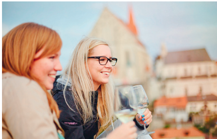
■ Vyzkoušejte si netradiční degustaci. Poznáte víno po sluchu? Rozeznáte dotek vína? Zadržte správně vůně k jednotlivým odrůdám?

Akce Víno všemi smysly se již vloni setkala s obrovským zájmem. Organizátoři ji proto přesunuli do větších prostor, kde si více lidí může vychut-