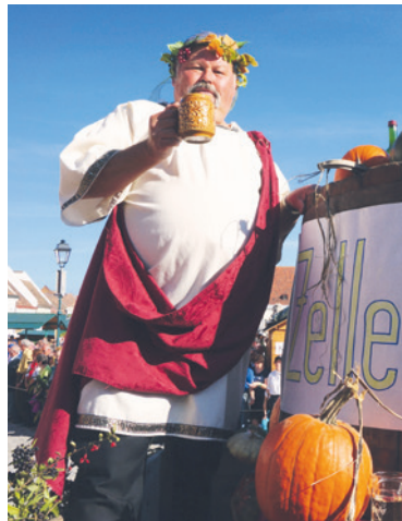
■ I v Retzu vám bude nabízet víno veselé Bacchus.

Vinobraní v Retzu je událostí roku pro všechny milovníky vína. Šedesáté druhé vinobraní našich rakouských sousedů je oslavou radosti ze života, vášně a pohostinnosti. Nenechte si ho proto ujít!