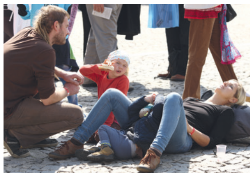
■ Vinobraní leckoho zmůže. Odpočinek letos nabízí několik míst přímo v centru dění.

Cíleně na rodinu je pak zaměřena klidová zóna v Horním parku mezi budovou Sokola Znojmo a sportovní halou na ulici F. J. Curie. Zábavný