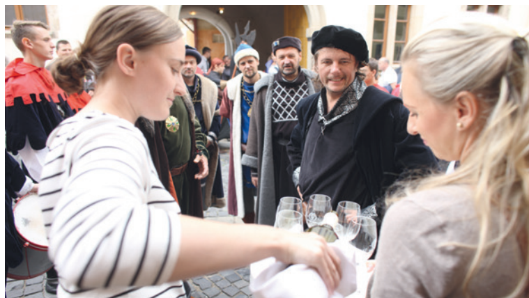
■ Mázhauzy budou košelé otevřít v pátek od 14.00 hodin, v sobotu pak od 10.00. Vinobraní je jedinečnou příležitostí, jak tyto prostory, veřejnosti přes rok obvykle nepřístupné, navštívit.