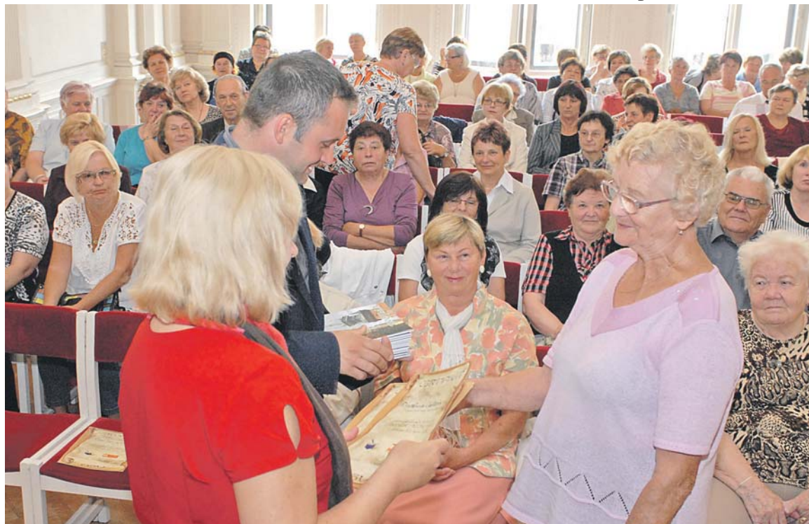
Předávání certifikátů absolventům Akademnie III. Věku pořádané znojemskou knihovnou.