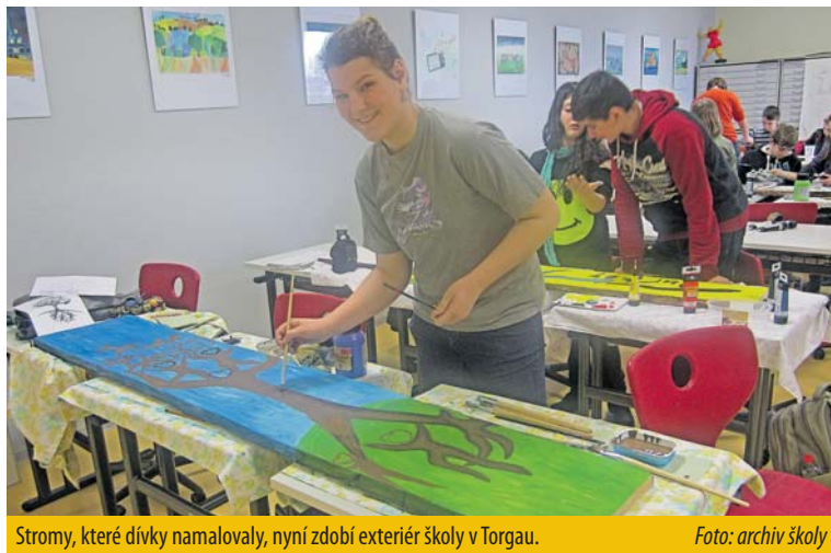
Stromy, které dívky namalovaly, nyní zdobí exteriér školy v Torgau.