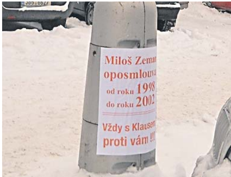
V době prezidentských voleb zadrželi městští strážníci ženu a muže z Prahy, kteří po Znojmě na černo vylepili desítky plakátů. Nelegální výlep bude nová firma eliminovat.

Po novém správci požaduje radnice jednotné zajištění vzhledu reklamních ploch, jejich údržbu, instalaci moderních a k okolí šetrnějších plakátovacích ploch (nemají být kolem stromů a v zeleni), efektivnější systém výlepu a odstraňování starých plakátů, ale také úklid okolí a likvidaci či eliminaci nelegálního výlepu. „Budeme investorem celého projektu bez jakéhokoliv finančního příspěvku Města Znojma. Navíc město získá finanční příjem v podobě nájemného za pronájem pozemků a výrazně zvýhodněné podmínky výlepu pro své potřeby a potřeby organizací městem zřizova-