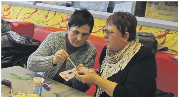
Na prezentaci masopustu se zrakově postižení klienti TyfloCentra za pomoci svého doprovodu pustili do výroby masopustních masek.

Který den v týdnu se pořádal masopustní průvod? Co je tradiční maska masopustu nebo z čeho je pučálka? Na tyto, a jim podobné otázky, odpovídali v masopustním testu klienti znojemského TyfloCentra, které čile spolupracuje s SOU a SOŠ na Přímětické ulici. Právě pro zrakově postižené klienty TyfloCentra připravili studenti prvního ročníku zcela nového studijního oboru Sociální činnost prezentaci o masopustu. Součástí pečlivě zvoleného programu byly nejen informace o historii masopustu a vědomostní test, ale také vystoupení pěveckého souboru školy pod vedením učitelky