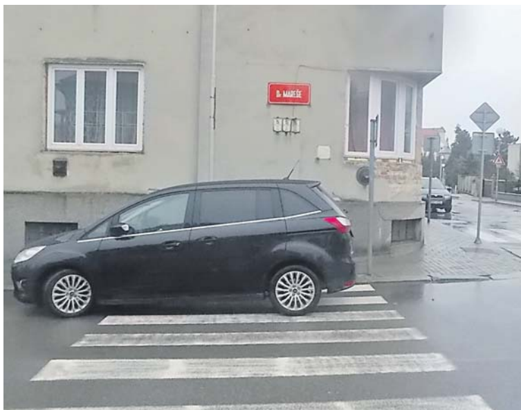
I takto dovedou někteří řidiči zaparkovat.

Odtah ovšem hrozí i těm řidičům, kteří zaparkovali své auto tak, že se stává překážkou bezpečnosti silničního provozu. Jde například o vozidla odstavená na křižovatkách, v úzkých uličkách, před garážemi a vjezdy do domů nebo právě na přechodech. V tomto případě hrozí neukázněnému řidiči kromě odtahu auta také přestupková sankce. Více informací o blokovém čištění najdete na webových stránkách města www.znojmo.cz . Od dubna mohou řidiči tamtéž najít seznam ulic a termíny blokového čištění. xa