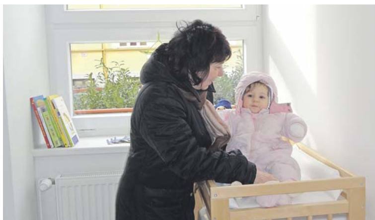
Při naší návštěvě jsme zastihli maminku, která ráda využila příjemné prostředí Family Pointu.

maminky s dětmi – chodit. V nově rekonstruované a vybavené útulné místnosti najdou přebalovací pult, mikrovlnnou troubu, varnou konvici i pohovku a křeslo pro odpočinek. Děti si mohou pohrát s připravenými hračkami,“ zve k návštěvě ředitel