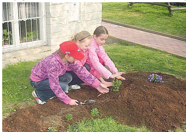
■ Mezi aktivity v Týdnu Země patří i vysazování nových rostlin.

parku a na závěr navštíví zahradu Domu dětí a mládeže. Pedagogové tak prostřednictvím Týdne Země vedou své svěřence k pozitivnímu vnímání ochrany přírody již od útlého věku. Už slavný filozof Sókratés věděl, že kdo chce hýbat světem, musí pohnout nejdříve sám sebou. Ip