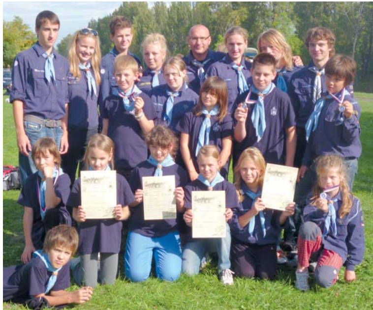
■ Veškerou vodáckou výuku vedou kvalifikovaní a zkušení instruktoři – vodáci, kteří mají akreditaci Ministerstva školství.

ovládat kánoi na rychleji tekoucí vodě (řeka Jihlava, Sázava, Vltava, Hron), což je fyzicky i technicky náročnější. Ti nejlepší a nejšíkvnější zasednou v zimě do kajaku a na znojemském