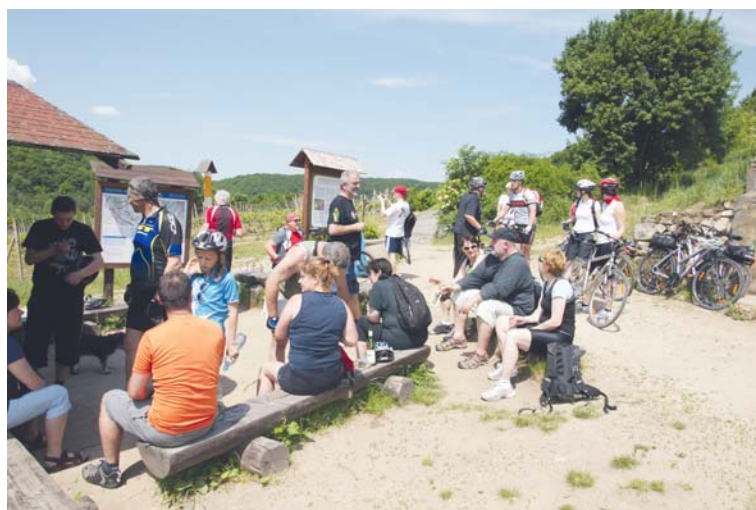
■ Cyklistika na Šobesu.

Cyklistika už není módní záležitost, ale součást moderního životního stylu. Výhody a prospěšnost jízdy na kole je všeobecně známá a podpora samosprávy a státních institucí se každým rokem zvyšuje. Široký výběr značek a druhů kol uspokojí i náročné zájemce a podporuje celkový zájem o cyklo dopravu. Nejrozšířenějším druhem kol je stále horské kolo v různých variantách. V posledních letech se zvětšuje skupina majitelů krosových a trekkingových kol. V pomyslném ko-