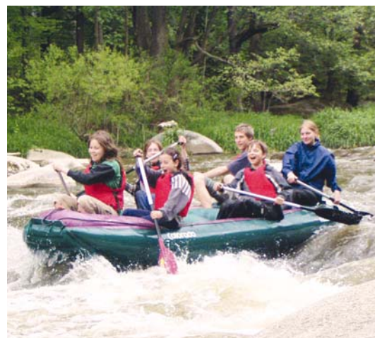
■ Na divoké řece.

Děti ve věku 7–13 let, které by se rády staly členy Vodáckého oddílu Neptunu Znojmo, mohou získat informace od Marcely Cejpkové (tel. 728 821 580) nebo na webu http://neptun.vodaci.org , kde jsou k dispozici také veškeré informace o oddílu. Každou sobotu od 8.00 do 12.00 (v zimě od 9.00 do 12.00) se konají pravidelné oddílové schůzky v Centru Vodárna. Roční členský příspěvek činí 400 korun na člena oddílu.