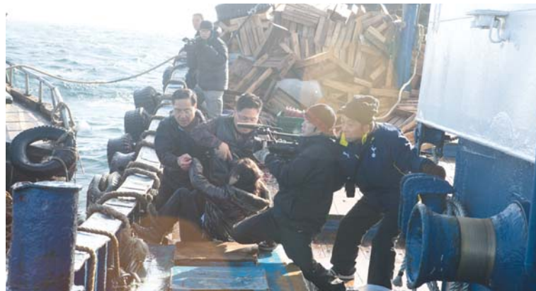
■ Neuvěřitelně napínavý snímek Po zemi, po moři uvidí diváci v kině první den festivalu.

„Jsme rádi, že Tomáš Etzler přistoupil na to, abychom se s ním spojili do Číny, přestože tam budou zhruba tři hodiny ráno. Učiníme tak pomocí skypu. Diváci v sále budou moci být