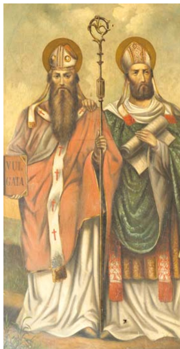
■ O pozvání soluňských bratrů Konstantina a Metoděje na Moravu se bezesporu zasloužil moravský panovník Rastislav, kterého pravoslavná církev svatořečila v roce 1994. Nyní bude jeho socha zdobit Hradiště.