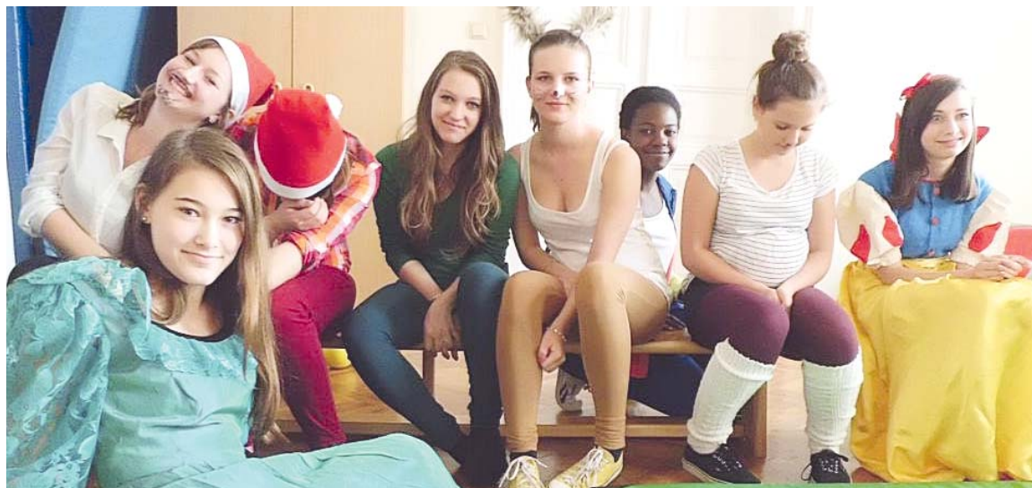
■ Už v prvním ročníku si troufli zahrát pohádky v němčině.