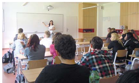
■ Ilustrační foto: Archiv ZL

jim svůj život a poradila, jak komunikovat s neslyšícím a jak se správně chovat v jeho přítomnosti. Žáci si mohli prohlédnout a osahat kompenzační pomůcky neslyšících a na cokoli se zeptat. Bez rozpaků se zapojili do diskuse a sami přispívali svými zkušenostmi a poznatky. Ve třídě vládli klid, zaujetí, zájem a pochopení. Přínos setkání nanejvýš výstižně shrnula slova jedné z přítom-