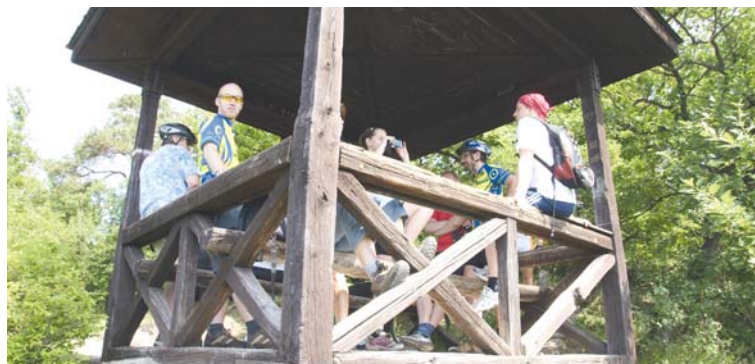
■ Vyhlídka na Králův stolec již dnes vypadá jinak.

Cestu zpět do Znojma můžeme nyní zvolit po spojovací cestě přes Hradiště. Nebo využijeme další variantu přes Citonice, přesněji přes vlakové