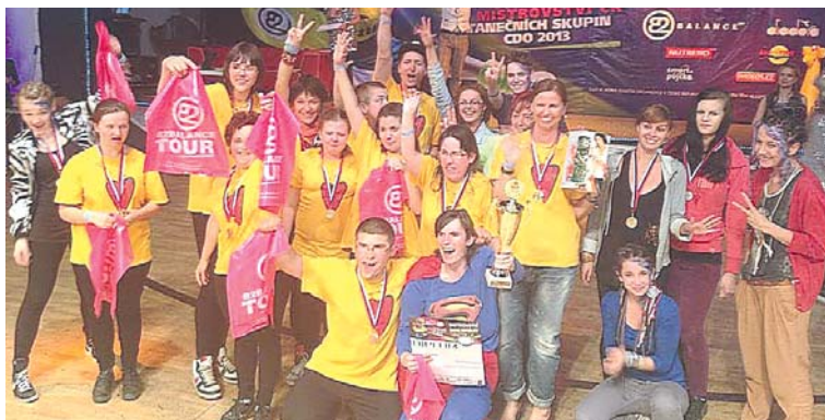
■ Tanečníci Mighty Shake Znojmo s Mistry ČR, kteří zvítězili s vystoupením Formace – Deformace.