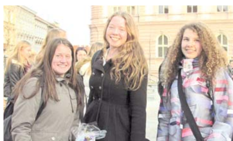
■ Holandské studentky před budovou znojemského gymnázia.

zou pro obě strany, českou i holandskou, je ubytování v rodinách. Večery trávené ve společnosti českých vrstevníků mohou pomoci Holanďanům k lepšímu poznání českého prostředí. A jako každoročně se v září k výměnnému pobytu do Harderwijku přestěhují studenti znojemského gymnázia Dr. Karla Polesného