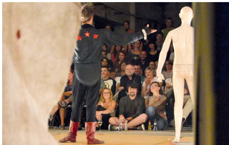
■ Divadlo Feste a představení Havel píše Husákovi v prostorách pivovarských garáží.