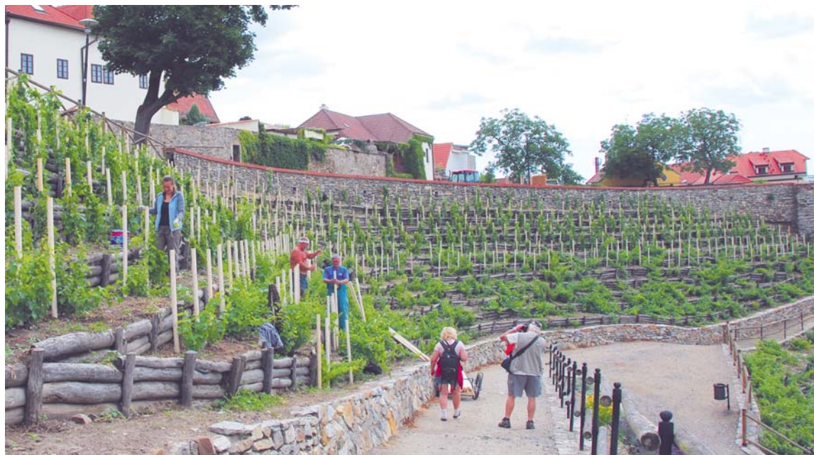
■ Pracovníci Vinařství Lahofer zatlukli do půdy na Rajské vinici dvě tisícovky kůlů. Při vedení „na hlavu“ se keře pěstují u samostatných kůlů. Jedná se o nejpracnější způsob pěstování révy.

nici je otevřen prakticky celou turistickou sezónou, v září denně od 11.00 do 20.00 hodin. ds, lp