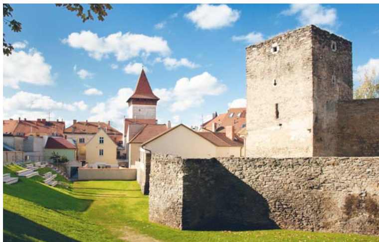
■ Hranolová věž v hradebním příkopu. Jeho prostor bude během vinobraní vyhrazen hlavně dětem.

Zastřešení věže bylo ze strany orgánů památkové péče zamítnuto, proto bude provedena oprava stávajícího středního pláště s aplikací izolace proti vodě, oprava rozvolněných částí vrcholu věže a odvodnění. Celková investice do oprav, které bude provádět znojmská stavební firma Jelínek, se vyšplhá na 888 000 korun. Zhruba čtvrtina nákladů by má být financována z dotace ministerstva kultury. O vinobraní bude hradební příkop s hranolovou věží místem pro hlídání a aktivity dětí. zp, lp