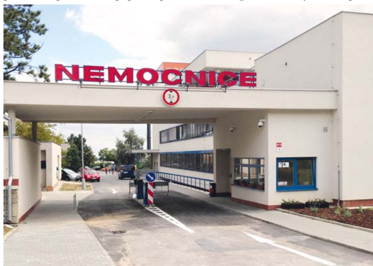
■ Hlavní vjezd do areálu znojmské nemocnice.

V případě poruchy parkovacího systému je možné volat telefonní číslo 515 215 222. V prvních týdnech po spuštění parkovacího systému zajistila nemocnice dohledem pověřeného pracovníka k eliminaci nenadálých událostí. lp