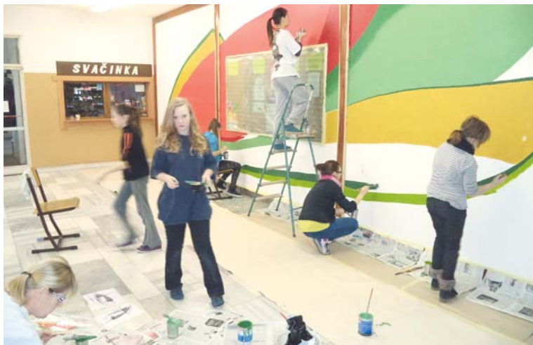
■ Žáci II. stupně za pomoci výtvarného oboru základní umělecké školy vyzdobili šest metrů dlouhou stěnu vstupní haly originálním abstraktním obrazem.