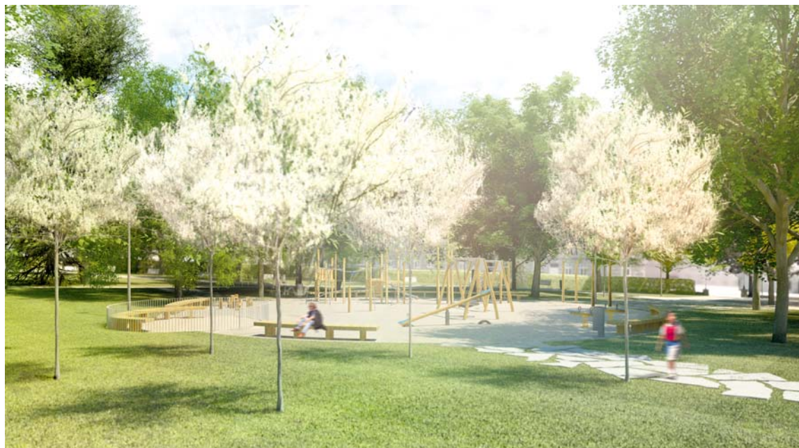
■ Vizualizace nové podoby dětského hřiště v dolní části parku.

Zástupci občanských spolků, Jiří Kacetl, Karel Fiala a Jaromír Boudný, předložili na jednání pracovní skupiny jednotný názor, který je zcela v rozporu s názory ostatních architektů ve skupině. Celý dopis, kde svůj nesouhlas s revitalizací parku rozvádějí, si můžete přečíst na straně 13. Zde pouze výňatek: „Nesouhlasíme proto s moderním architektonickým řešením, které navrhuje