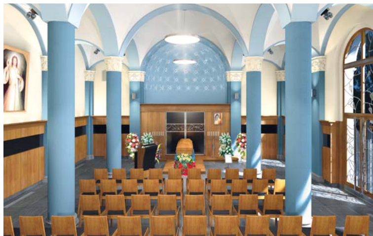
■ Vizualizace nové podoby smuteční síně.

rozšíření centrálního hřbitova. Na misce vah jsou nejen finance, ale především prostorové možnosti, neboť část pozemků je v soukromém vlastnictví. Dosud existuje pouze velmi rámcová architektonická studie případného budoucího uspořádání nových pietních míst. Znojemská radnice se však v následujících letech rozhodně dalšímu rozšíření městského hřbitova na Průmyslové ulici ve směru na ulici Dobšickou a Suchohrdelskou nebrání. xa