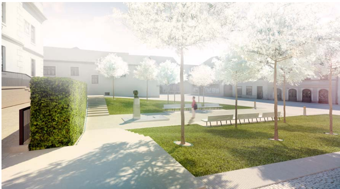
■ Nová podoba Divišova náměstí.

Závlahy zelených ploch se samozřejmě řeší. Odvodnění je směřováno do ulice Velká Michalská. Jemná terénní modelace Divišova náměstí zabezpečuje ve srovnání se současným stavem zpomalení odtoku dešťových vod. Okrasný živý plot zůstane zachován, ale prostor kolem něho se stane otevřeným veřejným prostorem – bude sloužit jako osvětlený chodník. Ztratí charakter anonymního nepřístupného místa. (Výškové řešení tohoto území je zřejmé z vizualizací, které jsou zveřejněny na http://www.znojmo-mestozelene.cz .)