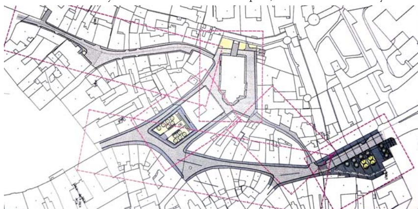
■ Vymezení celé lokality určené k regeneraci.

Divišova náměstí (kromě parkových úprav) a ústí náměstí Svobody.