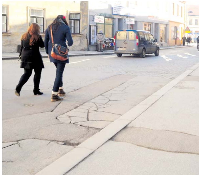
■ Současný stav chodníku a silnice na Velké Michalské.