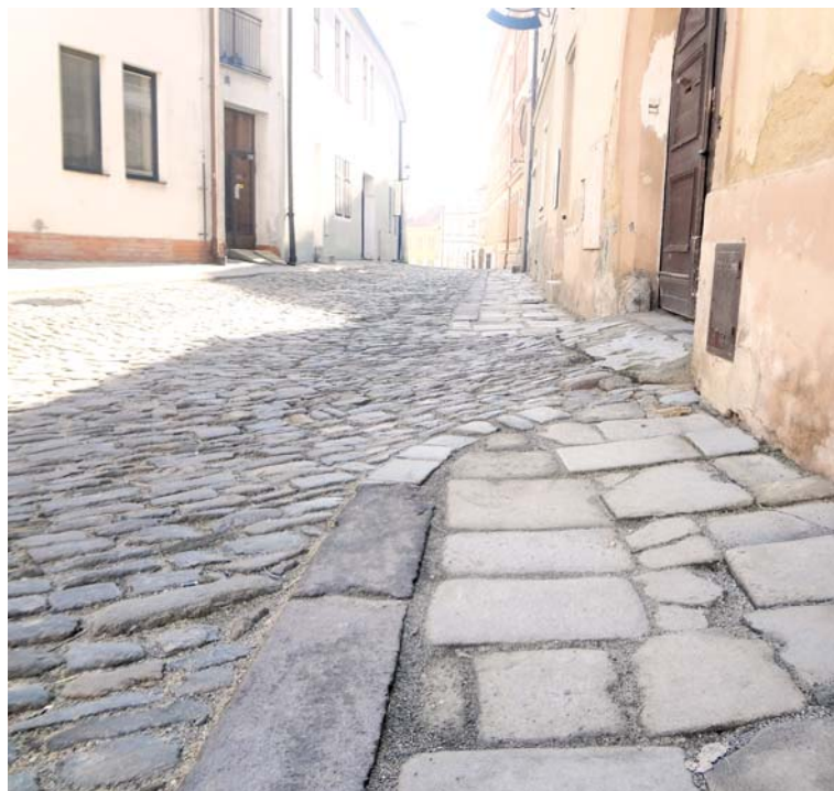
■ Povrch komunikací na Veselé ulici.

Silnice budou zadlážděny kostkami deset na deset centimetrů, položenými v kružkové vazbě. Dlažba je základním jednotícím elementem rekonstrukce MPR.