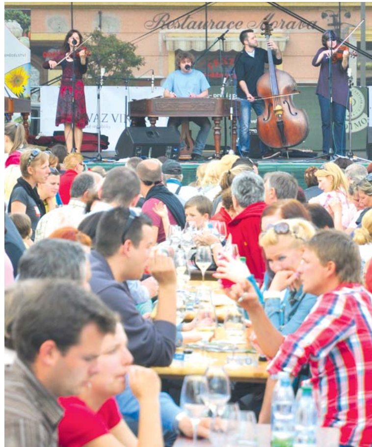
■ Každoročně přilákají květnové akce do centra Znojma tisíce návštěvníků.

znojenského pivovaru se na dva dny nastěhuje umění a design. Areál se tak opět promění, díky téměř padesátce vystavovatelů, v pestrý trh autorských výrobků. Zvát na něj budou mladí cyklisté, kteří budou jezdit na kolech mezi