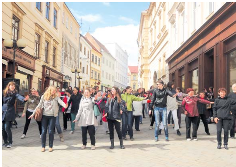
Flash mob v centru Znojma budil úsměv i pozornost, stejně jako se to děje v jiných městech ve světě.

Kolemjoucí se buď přidají, což je žádoucí, nebo jen s úsměvem na tváři pozorují bláznivou partičku lidí. A o úsměv jde při flash mobu především. „Video z provedené akce, ke které se přidali i Znojemské Gracie, se již připravuje. K vidění bude na webu