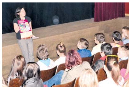
■ Po skončení každého dokumentu se ještě dlouho o zfilmovaném tématu hovořilo.

O tom, že lidská práva nejsou pro Znojmany jen prázdným pojmem, svědčí 1200 diváků letošního ročníku. „Jeden svět o problematice lidských práv informuje emotivně, ale i s vtipem. Navíc měli diváci možnost po zhlédnutí filmu diskutovat o dané problematice, což dodává Jednomu