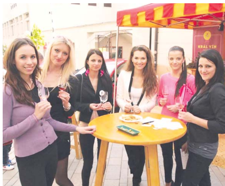
■ Půvab a víno Jarovínu.