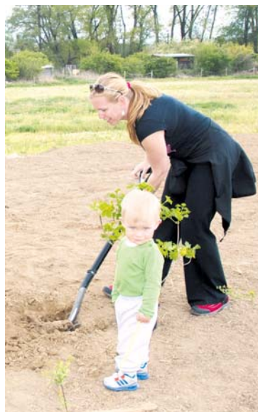
■ O výsadbu stromů a keřů byl zájem.

Akci pořádalo město Znojmo ve spolupráci s obcí