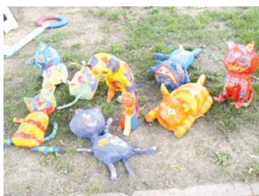
■ Kočky vytvořené dětmi výtvarného oboru ZUŠ Znojmo.

Základní umělecká škola ve Znojmě pořádá pro šikovné děti talentové zkoušky. Do dvou budov školy mohou přijít zájemci o hudební, výtvarný, taneční a dramatický obor 15., 16. a 20. května.