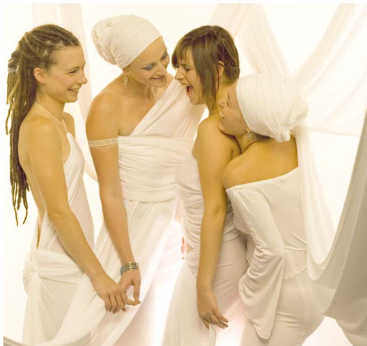
■ Žluté sestry nebo-li originální hudební seskupení matek Yellow Sisters.

10.00 Ranní rozproudění těla – muzikoterapie 12.00 ZÁVODY KACHNIČEK – tradiční zábava na řece Dyji.