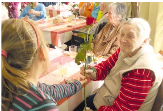
■ Růže od dětí udělala radost v Domově pro seniory v Jevišovicích.

ním zazpívat děti z místní základní školy a do DPS na Vančurově ulici ve Znojmě po roce zavítali operní pěvci z Brna. lp