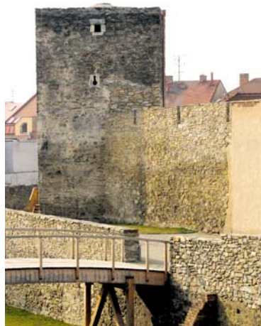
■ Hranolová věž stojí v těsné blízkosti dolního parku.

S jejím zpřístupněním veřejnosti se počítá v hlavní turistické sezoně, tedy v červenci a srpnu. „Jelikož se jedná o novinku, je nutno prvně prověřit zájem veřejnosti, proto není zatím stanoven minimální počet zájemců o prohlídku a prohlídka s průvodcem se bude konat denně vždy ve 14.00 hodin,“ vysvětluje Koudela. „O zakomponování prohlídky hranolové věže do svých tematických prohlídek měs-