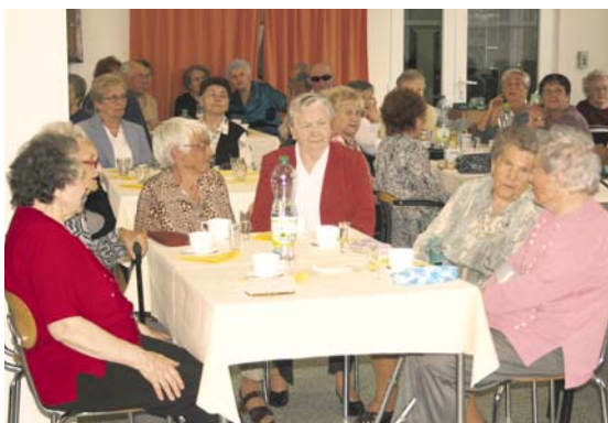
■ Na oslavě v Domově pro seniory na Vančurově ulici.