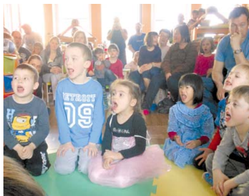
■ Děti, které potřebují logopedickou péči, přibývá. Mateřská škola na Pražské jim pomáhá již několik let.

Logopedické chvilky jsou téměř každodenní součástí vzdělávacího programu a také na schůzkách s rodiči logopedky ukazují, jak s dětmi v této oblasti pracovat. „Další aktivitou je