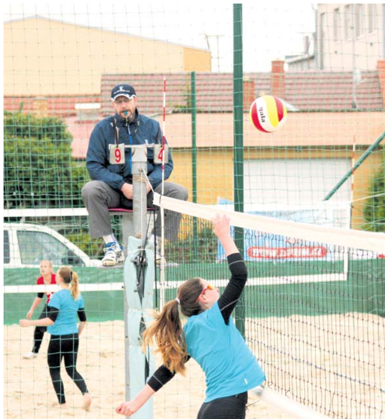
■ Kurty v Příměticích hostily výkvět juniorského beachvolejbalu.