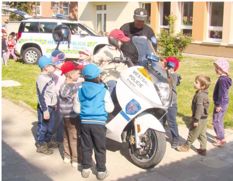
■ O zvědavé děti nebyla na ukázce práce strážníků nouze.