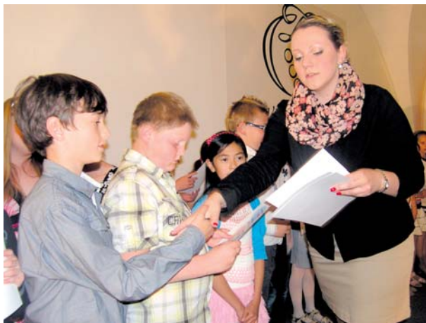
■ Předávání certifikátů úspěšným žákům základní školy JUDr. Mareše.