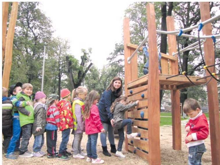
■ Nového hřiště využívají i děti ze škol v okolí parku.

Revitalizace této části Dolního parku započala radnice na sklonku minulého roku. Architekti zde zachovali původní historické řešení daného prostoru i dochované historické prvky parku jako je kašna, kamenná zídka nebo litinové vstupní oblouky s osvětlením. Zároveň park dostal moderní