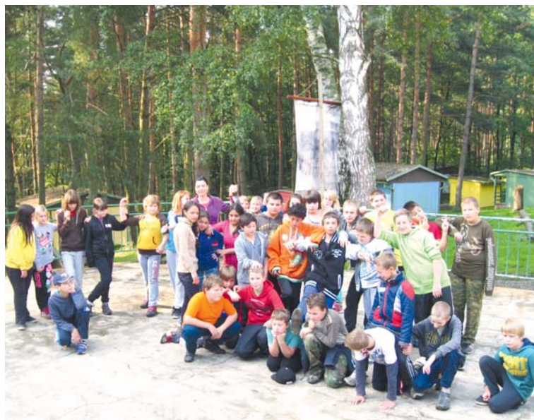
■ Nový kolektiv žáků šestých tříd.

„Do šesté třídy většinou nastupují děti z jiných tříd nebo i škol. Navzá-