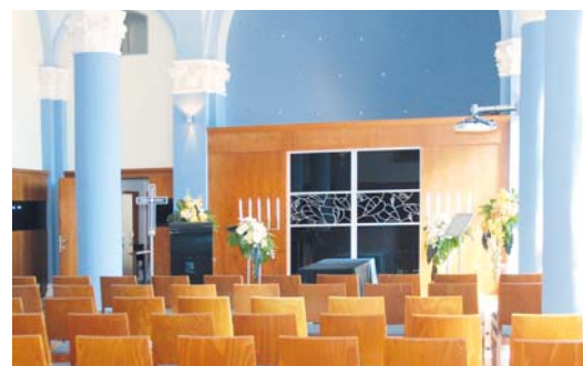
■ Nový interiér smuteční síně.

pro zájemce, kteří do ní budou moci nahlédnout. xa, lp