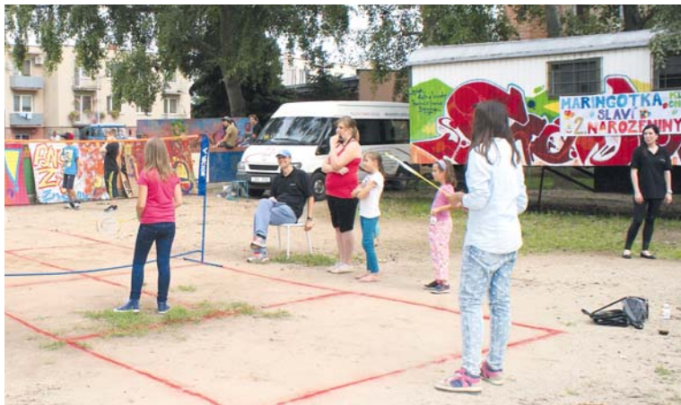
■ S notnou dávkou skvělé zábavy oslavila maringotka Klubu Coolna druhé narozeniny.

Hudbu, smích, příjemnou atmosféru, spoustu her, graffiti, tanec, žonglování, turnaj v badmintonu a stolním fotbalu a ještě mnohem víc si užívali gratulanti na oslavě druhých narozenin maringotky znojemského nízkoprahového Klubu Coolna.