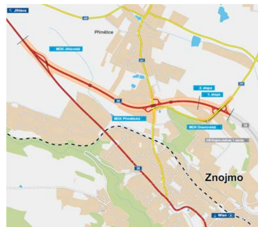
■ V příštím roce se začne se stavbou části obchvatu, kterou vidíte na mapce.

ské radnice také o modernizaci silnice I/53 Znojmo-Pohořelice. „Máme představu, že by se současná I/53 měla proměnit v obdobu rakouských „Schnellstraßen“, které jsou velmi bezpečné a hojně využívané,“ uvádí starosta Vlastimil Gabrhel. Zatím se podle starosty na ŘSD podařilo prosadit stavbu obchvatu Lechovic. SFDI do něj investuje 360 milionů korun. Také stavba obchvatu Lechovic začne příští rok. mp