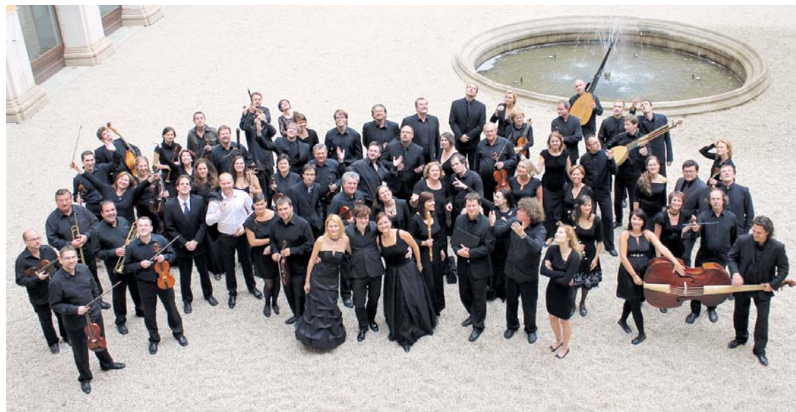
■ Czech Ensemble Baroque.