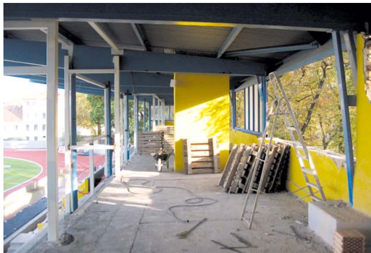
■ Zázemí stadionu se mění k nepoznání.

Základem stadionu zůstane železobetonový monolitický skelet s železobetonovou zalomenou deskou ve tvaru stupňů, která je navržena jako střešní plášť pro vnitřní vestavěné místnosti. Vnitřní dispozice hlavní tribuny se však změní k nepoznání. V prvním patře budou umístěny šatny