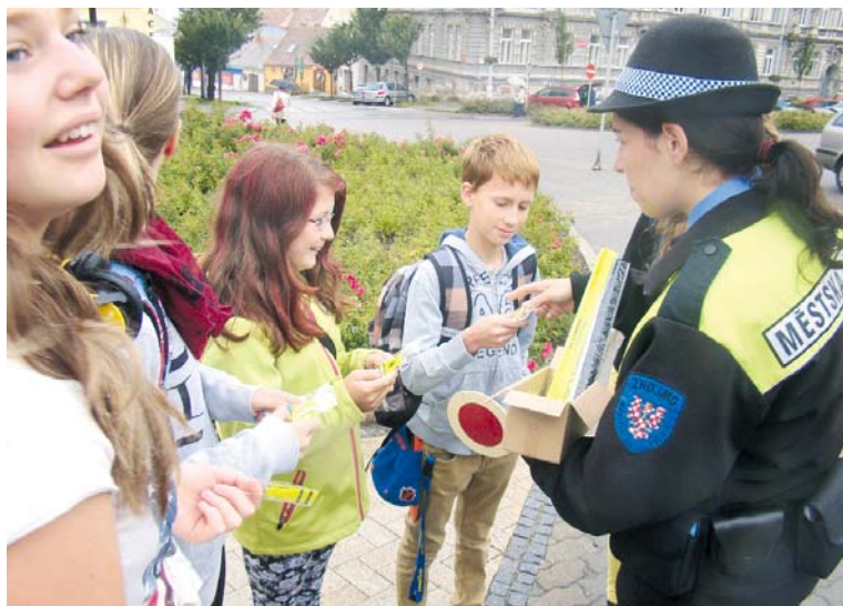
■ Strážníci rozdávali dětem reflexní drobnosti vhodné při přecházení silnice v případě snížené viditelnosti. Řidiči si tak malých chodců snadněji všimnou.

Pod dvouměsíční prázdninové pauze se na vytipované přechody v blízkosti škol vrátili strážníci Městské policie Znojmo, aby dohlíželi na bezpečné přecházení především dětí.