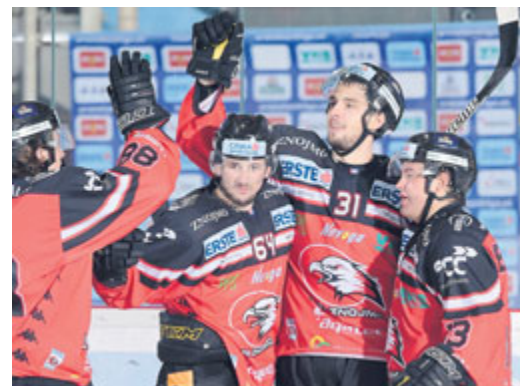
■ Orli Znojmo.

Znojemské hokejisty čeká v období vánočních svátků tradičně velmi nabitý program. Na domácím ledu se představí mezi svátky dvakrát, 26. a 28. prosince, následně až po Novém roce. Rychlý sled utkání napoví, zda se jim podaří probojovat do první šestky, která zajišťuje účast ve vyřazovacích bojích. Zatím k ní mají znojemští hráči skvěle nakročeno. Přijďte je podpořit a zpestit si sváteční čas!