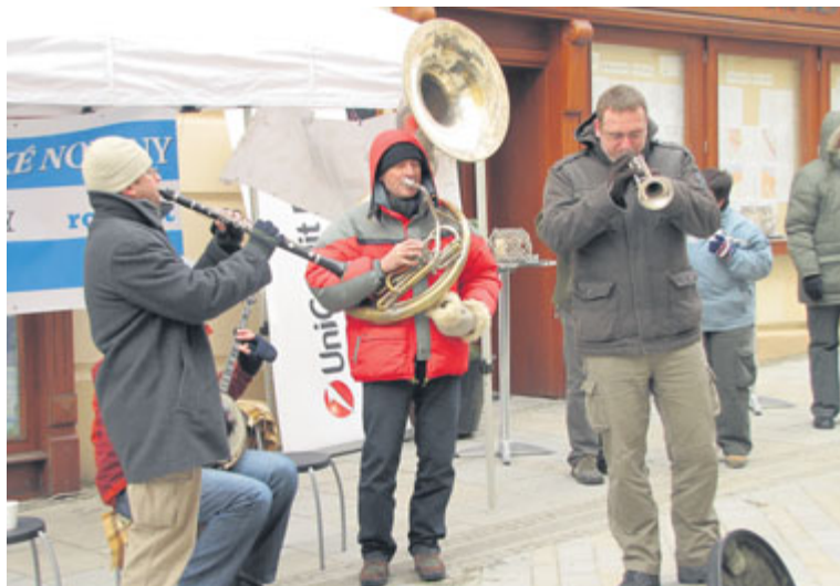
■ Zmrzlý jazz a Kouda's Quartet v akci.

Vstupenky na jednotlivé koncerty ponejvíce v hodnotě symbolických 100 korun v předprodeji (150 na místě) si můžete již nyní zakoupit v TIC na Obrokové ulici. lp