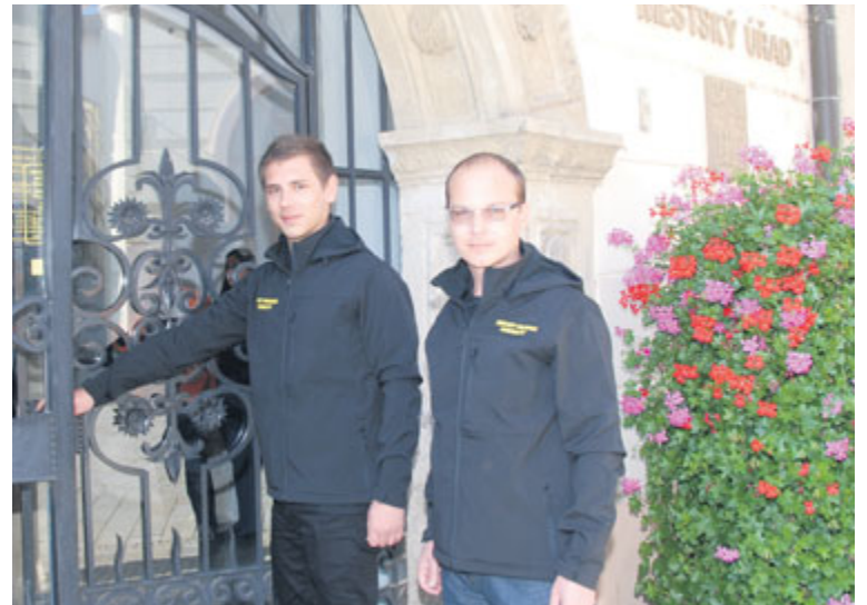
■ Asistenty lidé poznají podle pracovních oděvů s nápisem Asistent prevence kriminality.

Zatím se s nimi občané mohou setkat v objektech městského úřadu a na znojemském Úřadu práce. Jejich úkolem je mírnit emoce některých nespokojených a naštvaných občanů. V budoucnu by se měli pohybovat i v lokalitách, kde dochází k častějšímu porušování veřejného pořádku a upozorňovat občany na jejich protiprávní jednání. V okolí základních škol budou dohlížet na to, aby byla zajištěna bezpečnost dětí a předešli některým sociálně-patologickým jevům.