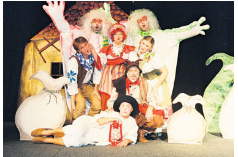
■ Pohádka O pokladu ve mlýně.