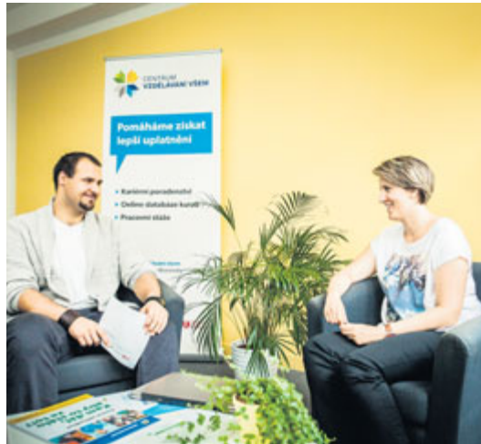
■ Kosobní konzultaci je třeba se předem objednat.

Je toho opravdu hodně, ke každému klientovi přistupujeme individuálně a vycházíme vstříc jeho potřebám. Já osobně se snažím s lidmi pracovat i na základě nových a efektivních