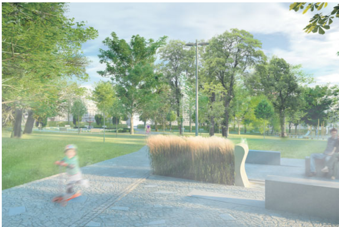
■ Vizualizace Dolního parku.

Zastupitelé rozpočet na rok 2016, jehož součástí je i revitalizace parku, schvalovali až po uzavěření LISTŮ, více informací proto přineseme v dalším vydání 21. ledna. zp