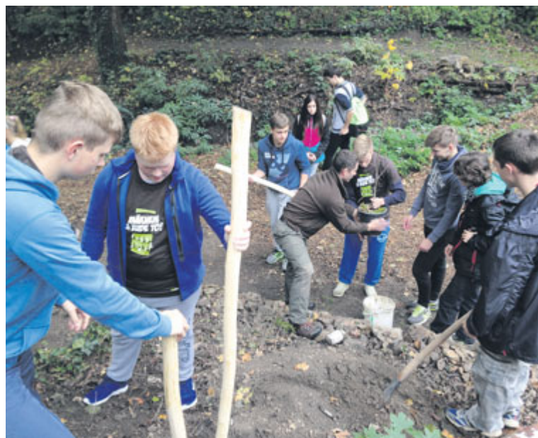
■ Ke kořenům nově zasazené lípy uložili studenti jména všech, kteří přiložili ruku k dílu při úklidu Gránic.