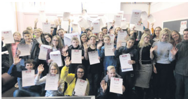
■ Žáci v Anglii. Ochotně reagují na podporu jazykového vzdělání, kterou jim škola poskytuje.

Čtyřicet nejlepších žáků Základní školy na ulici Mládeže odjelo na zkušenou do Velké Británie. Vycestovat mohli díky aktivitě školy, která se na jaře přihlásila do evropského projektu a získala tak pro své žáky peníze na organizaci jazykové poznávacího zájezdu.