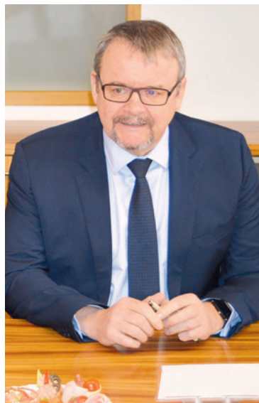
■ Ministr dopravy Dan Ťok.

Podobně to vidí i starosta. „Čekáme pořádku na písemné odůvodnění soudu, na základě kterého bychom mohli podat kasační stížnost, kterou samozřejmě zvažujeme. Pokud tu máme obchvat, který je celá léta zanesen v našem platném územním