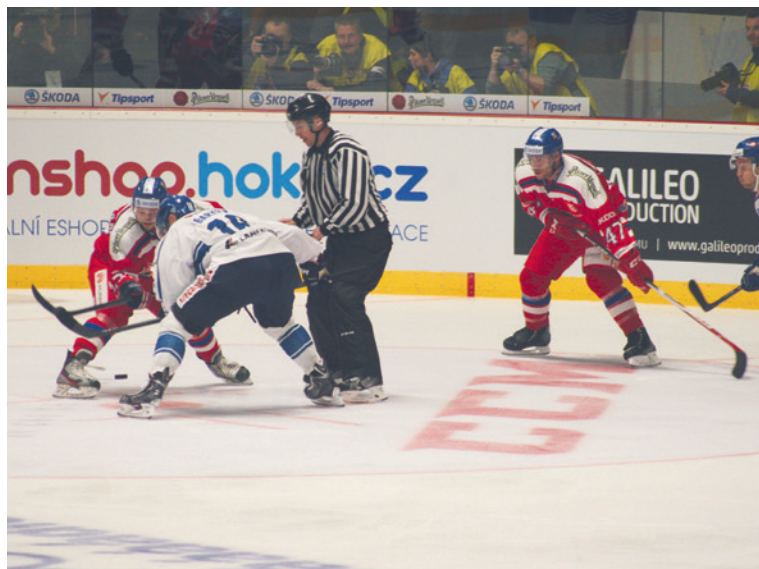
■ Po finské reprezentaci uvidí znojemské publikum také švédský národní tým.

„V loňském roce se podařilo akci tohoto typu dostat do Znojma po mnoha letech. O to cennější je, že se nám to po roce povedlo znovu zopakovat. To, že se na našem stadionu opět představí česká hokejová reprezentace, je odraz dlouhodobé usilovné práce celého vedení klubu. Velký dík samozřejmě patří také městu Znojmu, které nám vytváří takové podmínky a je nám nápomocno, abychom tyto zápasy mohli na našem zimním stadionu pro znojemské sportovní fanoušky uspo-