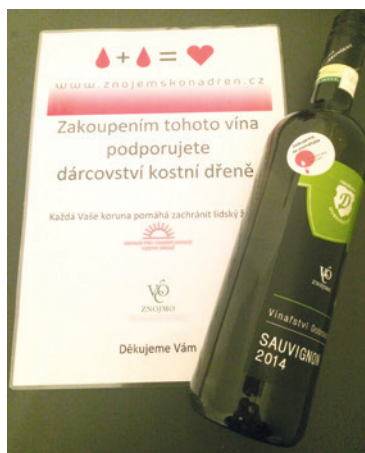
■ Vína, darovaná vinaři z VOC Znojmo, mají speciální etiketu.

Mnohé dámy, které v rámci Znojenských Velikonoc přišly do stanu Kabelkománie na Horním náměstí, si kabelky za symbolické ceny nejen koupily, ale také další k prodeji přinášely. Vzhledem k tomu, že obrovské množství kabelek se prodalo hned v první den, byl přísun nového zboží skoro záchrannou, která ale ve výsledku určitě