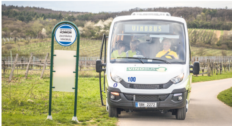
■ Vinobus již brázdí Znojemsko.

ré z vinařských obcí vystoupit a pokračovat v jízdě na svém kole. Pro větší skupiny je možné si Vinobus objednat i zvlášť. Trasy jsou upravované tak, aby nabízely maximálně atraktivní zastávky. Každá z nich je označena informačním panelem. Více informací na vinobus.vocznojmo.cz nebo na facebooku VOC Znojmo. lp