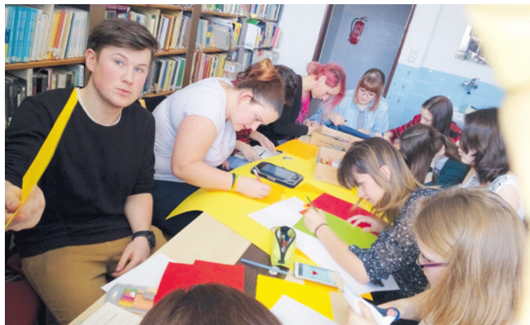
■ O Literární bar byl i letos mezi studenty zájem. „Tak trochu jiný bar“ již poněkoličtější vřívá vždy v březnu škola na Přímětické ulici.

Setkáním na Literárním baru si každoročně připomínají březen, měsíc knihy, studenti střední školy na Přímětické ulici (SOU a SOŠ SČMSD).