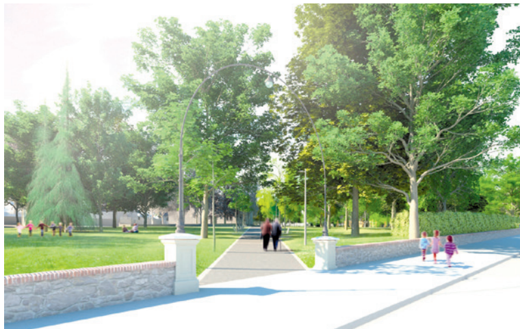
■ Vizualizace nové podoby dolní části parku.

Revitalizace Dolního parku pokračuje až do podzimu a součástí plánovaných prací je také důležitá rekonstrukce městského vodovodu, který prochází parkem, plní vodojem na náměstí Republiky a zásobuje celou jižní část Znojma. Více informací o revitalizaci parku najdete na www.znojmo-zdravemesto.cz . zp