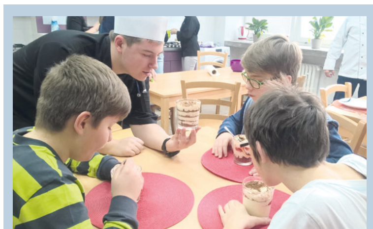
■ Žáci a studenti se postavili k jedné plotně. Žáci sedmých ročníků základní školy na Pražské se setkali s budoucími kuchaři a číšníky ze střední školy na Přímětické ulici, aby pokračovali v tradici společného vaření obou škol. Vydařená akce dostala zpětnou vazbu od mladších žáků v podobě zájmu nejen o obor Kuchař - číšník, ale i nadšení věnovat se vaření nadále. lp, foto: Archiv školy

Kontakt: Městský útulek Načeratice, tel.: 602 307 801, www.utulek-naceratice.blog.cz