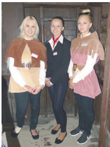
▪ Budoucí průvodkyně na praxi.

Začíná turistická sezóna, která otevře návštěvníkům brány hradů a zámků. Na některých je budou vítat také studenti oboru Cestovní ruch ze střední školy na Přímětické ve Znojmě, kteří se připravují na své budoucí povolání průvodců.