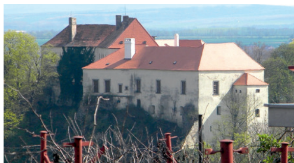
■ Pohled na znojemský hrad z místa budoucí stanice záchranky.

Problém ale nastal v tom, jakým způsobem byl proveden výběr stavebního místa a jak do rozhodování byla zapojena občanská i odborná veřejnost ve Znojmě. Když jsem pana starostu Gabrhela na zasedání zastupitelstva v prosinci 2014 žádal, aby jako krajský zastupitel a poslanec parlamentu v jed-