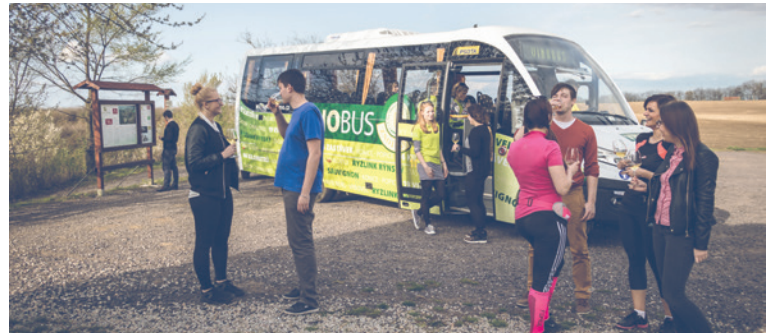
■ Vinobusem se podíváte za dobrým moravským vínem.

né vidět Vinobus přímo na Horním náměstí. Součástí kulturního programu bude jeho slavnostní křest, kterého se zúčastní jeho největší podporovatelé – zástupci Jihomoravského kraje, města Znojma, Vinařského fondu ČR a obcí Tasovice a Chvalovice. Již v loňském roce Jihomoravský kraj podpořil nákup Vinobusu částkou 1 milion korun, ta byla použita na pořízení autobusu. Kraj také přispěje po dobu tří let na provoz Vinobusu 300 000 korun. Město Znojmo podpoří Vinobus v následujících třech letech vždy částkou 200 000 korun. „Znojemsko je vinařským regionem a projekt Vinobusu má velký potenciál, jak oživit zdejší turistický ruch. Jde o službu, kterou nenabízí zatím žádné jiné město či region, přitom má své kouzlo a jistě naláká