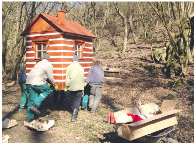
■ Umístění pohádkové chaloupky, která je novým cílem procházek rodičů s dětmi.

S dekoracemi interiéru chaloupky pomáhali studenti Základní umělecké školy ve Znojmě a při její instalaci na pečlivě vybrané místo bylo pamatováno Lesy i na úpravu přilehlé cesty a okolí. lp