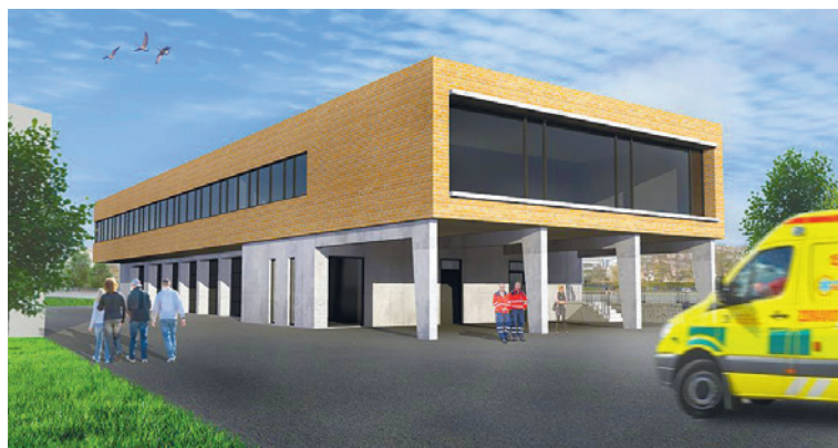
■ Vizualizace nedávno zahájené stavby výjezdni stanice Zdravotnické záchranné služby JMK ve Znojmě, kdy na jednom místě bude Policie České republiky, Hasičský záchranný sbor a Zdravotnická záchranná služba. Půjde o druhé takové zařízení v celém Jihomoravském kraji.

Na úvod bych rád řekl, že jsem velmi rád, že se ve Znojmě podaří realizovat integrovaný model, kdy na jednom místě bude působit Policie České republiky, Hasičský záchranný sbor a Zdravotnická záchranná služba. V celém Jihomoravském kraji se bude jednat teprve o druhé takové zařízení a na to jsem velice pyšný. Každý, kdo se občas setká s policisty, hasiči nebo záchranáři, slyší, jak je důležité, aby tyto složky spolu dobře, rychle a efektivně komunikovaly a aby se na místo nehody, požáru nebo incidentu dostaly včas. I pro mě jako starostu města je bezpečnost a zdraví občanů to nejdůležitější. Nezapomínejme také, že hasiče, záchranku a policisty nepotřebují jen obyvatelé Znojma, ale celého regionu. I proto je zcela zásadní, aby měli výhodnou polohu. Ulice Pražská, kde budou všechny tyto tři složky sídlit, je hlavní znojemskou komunikací, díky které budou moci nejen rychle zasahovat v městě jako takovém, ale i v celém