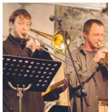
■ Ilustrační foto

V letošním roce je stanoveno šest dotačních programů, o které bude možné žádat v termínu od 10. do 31. října 2016. Nově se lze objednat na konzultační schůzku ohledně poskytování dotací, kde budou zodpovězeny všechny dotazy.