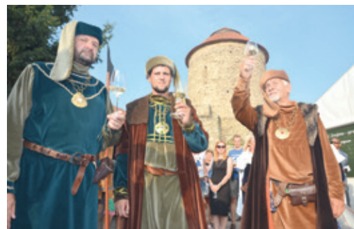
■ Vydařený 33. ročník vinobraní se uskutečnil za podpory města Znojma, Jihomoravského kraje a Vinařského fondu České republiky a byl pořádán pod záštitou ministra zemědělství Mariana Jurečky.

Na hrad, který se letos výrazně otevřel veřejnosti, zaměřily i stovky lidí na akci Víno všemi smysly. Díky velkorysému prostoru si tak mohlo na netradiční degustaci více návštěvní-