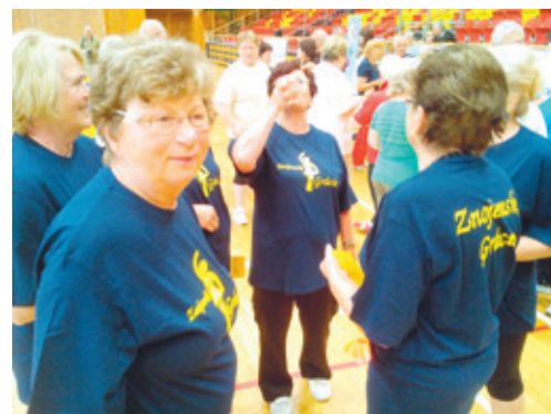
■ Vyšší věk znojemským seniorům nebrání chodit do společnosti a dobře se bavit.

Mezinárodní den seniorů si svět připomíná vždy 1. října již od roku 1998. Den seniorů je oslavou všeho, co staří lidé společnosti přinášejí. Zároveň zvyšuje povědomí o problémech, se kterými se potýkají, jako například jejich zneužívání bezcharakterními lidmi z řad takzvaných šmejdu, ale mnohokrát i od nejbližších.