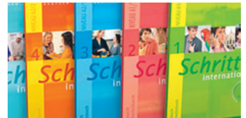
■ Při výuce německého jazyka pracují lektori studia také s těmito učebnicemi, které používají i na mnohých školách. Ilustrační foto

V PRIMA jazykovém studiu lze kdykoliv během roku začít také s individuální výukou.