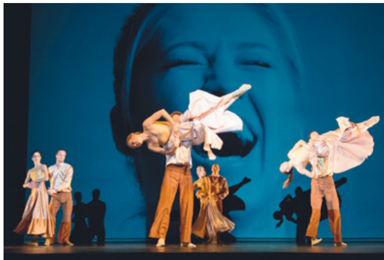
■ Slovanský kvartet v podání Pražského komorního baletu.

Vyznavači klasického divadelního žánru se naopak mohou již 24. října potěšit inscenací Shakespeareova Romea a Julie v podání pražského Divadelního spolku Kašpar pod vedením režiséra Jakuba Špalka. Nejslavnější milostný příběh o lásce i nenávisti nabízí divadelníci od Kašpara v jedinečné úpravě. Text, patřící k vrcholným tragédiím mýty opředěného autora,