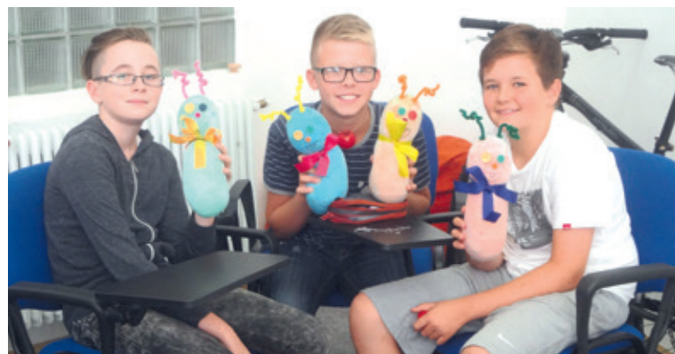
■ Vítězné družstvo v českém jazyce si odneslo „bludišťáky“ vytvořené studentkou vyššího ročníku, která pro ně také připravovala základné češtinářské otázky.

Že s úsměvem jde všechno líp, dobře vědí studenti gymnázia K. Polesného ve Znojmě, kteří si mnohokrát prověřenou větu zvolili jako motto letošního školního projektu.