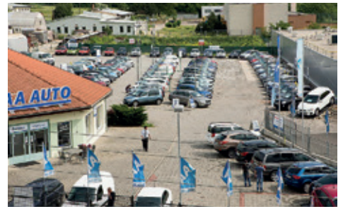
Modely značky Škoda tvoří v současnosti zhruba třetinu z 8000 vozů v nabídce AAA AUTO v České republice.

nemožné tyto vozy sehnat. Proto klesá i zájem lidí vozit tyto škodovky zpět do České republiky. „Škoda Octavia I a II patří mezi českými zákazníky mezi nejoblíbenější importy, a to především díky dobrému poměru ceny a výkonu vozu. Kvůli zvýšené poptávce za hranicemi však jejich cena roste na úroveň, kterou už tuzemští zájemci nejsou ochotni zaplatit,“ říká manažer AAA AUTO Znojmo, Jan Langhans. Modely značky Škoda tvoří v současnosti zhruba třetinu z 8000 vozů v nabídce AAA AUTO v České republice.