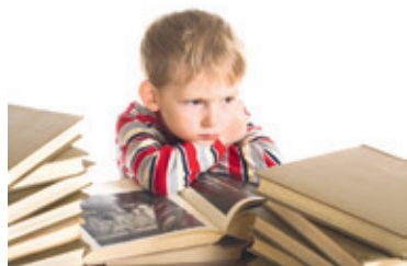
■ Učení nemusí být „mučení“.

Ve Znojmě bylo otevřeno první studijní centrum, které pomáhá dětem s učením. Pod jménem BASIC ho najdete na Sokolské ulici.