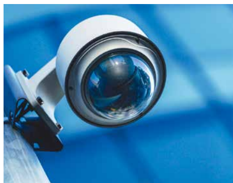
■ Ilustrační foto.

„Znojmo je bezpečným místem pro život. Na druhou stranu bychom neměli v oblasti prevence zaspát. Musíme dávat jasně najevo, že žádnou trestnou činnost nehodláme tolerovat, ba naopak ji budeme účinnými nástroji eliminovat,“ říká starosta Znojma Vlastimil Gabrhel.