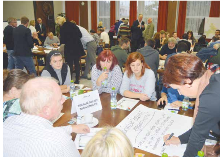
■ Diskutovat přišla téměř stovka lidí.