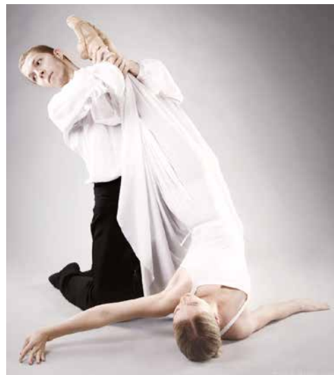
■ Balet 3 České kvartety.

Poslední listopadový den se divadelní pódium změní na Pánskou šatnu