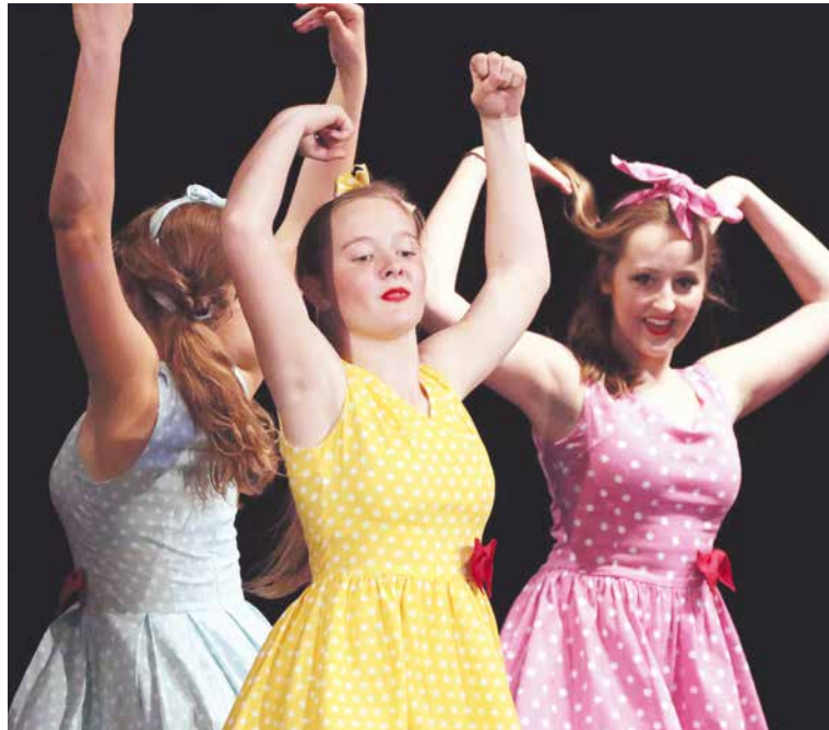
■ Milovníky tance potěší na jevišti divadla představení Tanečního a pohybového studia M&M Znojmo.

Návštěvníci divadla se mohou těšit na Pohodu u baru – směs písní Jaroslava Ježka s texty Voskovce a Wericha, semaforové písničky i muzikálové melodie. Zvědaví budou moci nahlédnout