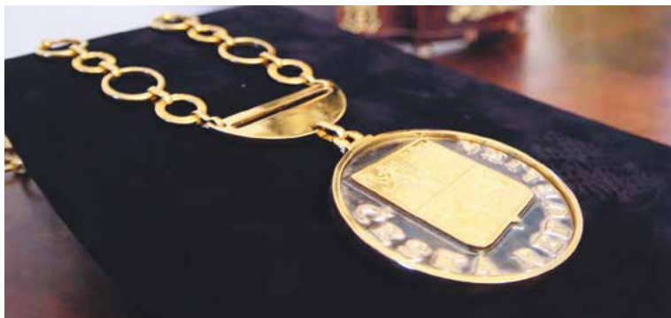
■ V Den otevřených dveří radnice jsou vždy vystaveny vzácné předměty, jindy lidem skryté.

Ti, kteří se budou chtít pokochat pohledem na Znojmo z výšky, mohou 17. listopadu v Den otevřených dveří radnice vystoupit na ochozy Vlkovy věže a radniční věže zcela zdarma. Připravená je také každoročně vyhledávaná komentovaná prohlídka radničních věžních hodin. zp, lp