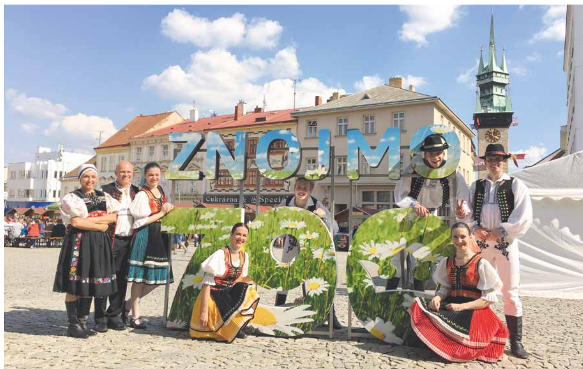
■ Číslo 790, odkazující na významný mezník v historii města, je letos ve Znojmě představováno v mnoha podobách i aktivitách. V době vrcholné turistické sezony bylo 3D logo Znojmo 790 vyhledávaným bodem k častému fotografování.

si zatančit na Setkání cimbálových muzik nebo si vybrat v bohaté kulturní nabídce, kterou najde na stranách 14 a 15. Více se o kulturních i sportovních akcích dozvíte uvnitř LISTŮ.