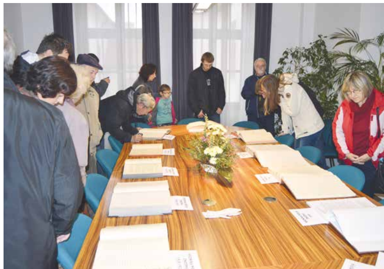
■ O prohlídku kronik města je vždy velký zájem.

Promítat se tu budou i nejnovější propagační filmy Znojma z dílny VideoBrothers, pod kterou jsou pode-