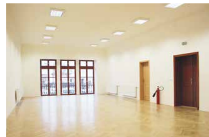
■ Nový sál

Znojmská Beseda bude sál využívat pro své akce, ale také ho bude