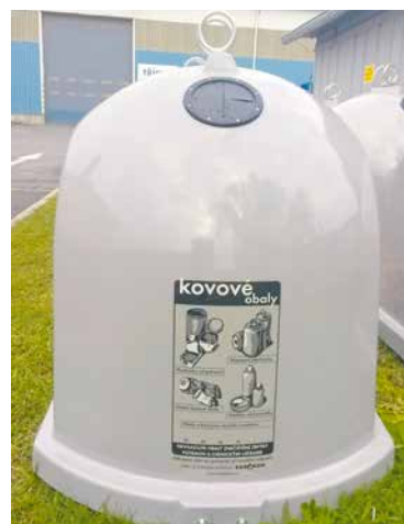
■ Kontejnery na kovový odpad zajistilo město Znojmo ve spolupráci s firmou FCC Znojmo.

nářská, Přímětická), Hálkova, Pražská (u Billy a Sezamu), Na Rejdišti (parkoviště u mostu), Fischerova (u fotbal. hřiště), na konci ulice U Lesíka a u prodejny potravin na Vančurově, Přímětická (u Penny Marketu) dále na nám. Svobody a na Masarykově nám. Kontejnery jsou také v Příměticích (u Agory), v Bohumilicích, Derflicích, Kasárnách, Konicích, Mramotičích a v Načeraticích. tp, lp