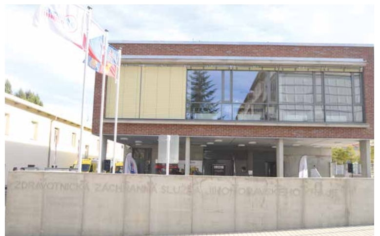
■ Nová budova záchranářů stojí v těsné blízkosti policejní stanice na Pražské ulici.

Stavba tohoto objektu je nejen zásadním přínosem pro organizaci, ale především pro obyvatelstvo v regionu. Územní oddělení Znojmo zasahuje na spádovém území o rozloze 1.590 km 2 s více než 110 tisíci obyvateli. Výjezdové týmy vyjíždí ze základen ve Znojmě, Hrušovanech nad Jevišovkou a Šumné. Nová základna výrazně změní pracovní podmínky záchranářů na Znojemsku. „Jsem nesmírně rád, že jsme otevřeli novou výjezdovou základnu záchrany. Díky tomu mají záchranáři daleko důstojnější pracovní