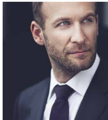
■ Hobojista Vilém Veverka.

Hned dva koncerty vynikajících českých umělců v jediném měsíci připravila Znojemská Beseda v městském divadle.